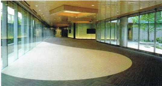
正面玄関内スペース

これを受けた評価手続きでは、価格、品質の両面で最も優れている提案が選ばれ、フランスの設計事務所 ADPI と協働してプロジェクトに取り組んだ大成建設株式会社が契約を受注した。