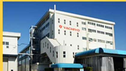
本社・工場 (狭山市)

※交通、その他の事情により行程の一部が変更される場合がございます。予めご了承ください。